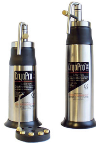
CryoPro® Mini & Maxi met standaard 6 open spraytips.

De CryoPro® spray unit functioneert op basis van vloeibare stikstof en wordt gebruikt voor cryochirurgische behandelingen. Het apparaat is zeer veilig, betrouwbaar en gebruiksvriendelijk. De lage temperatuur (-196°C), de verschillende contactpunten (tips) en de snelle genezingsgraad gecombineerd met een hoog cosmetisch resultaat maakt de CryoPro® tot een hoogwaardig, veelzijdig precisie instrument.