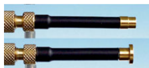
6 mm contacttip