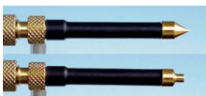
Scherp puntige contacttip