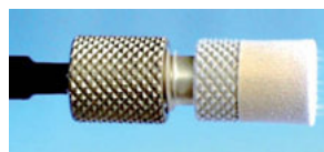
Speciale spraytip voor acné behandeling