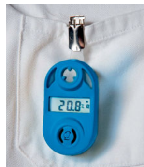
Portable zuurstof alarm